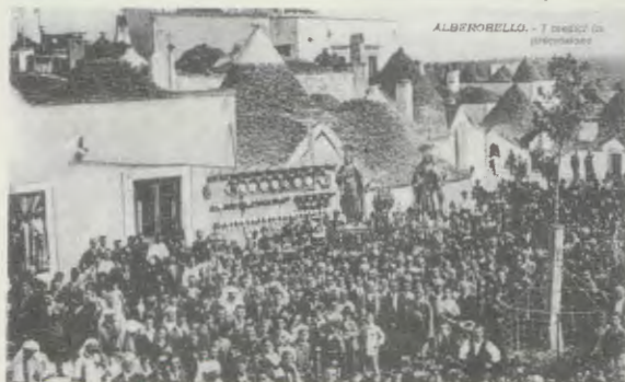
27 Settembre 1920 - sosta della Processione dei Ss. Medici Cosma e Damiano in Piazza Gian Girolamo