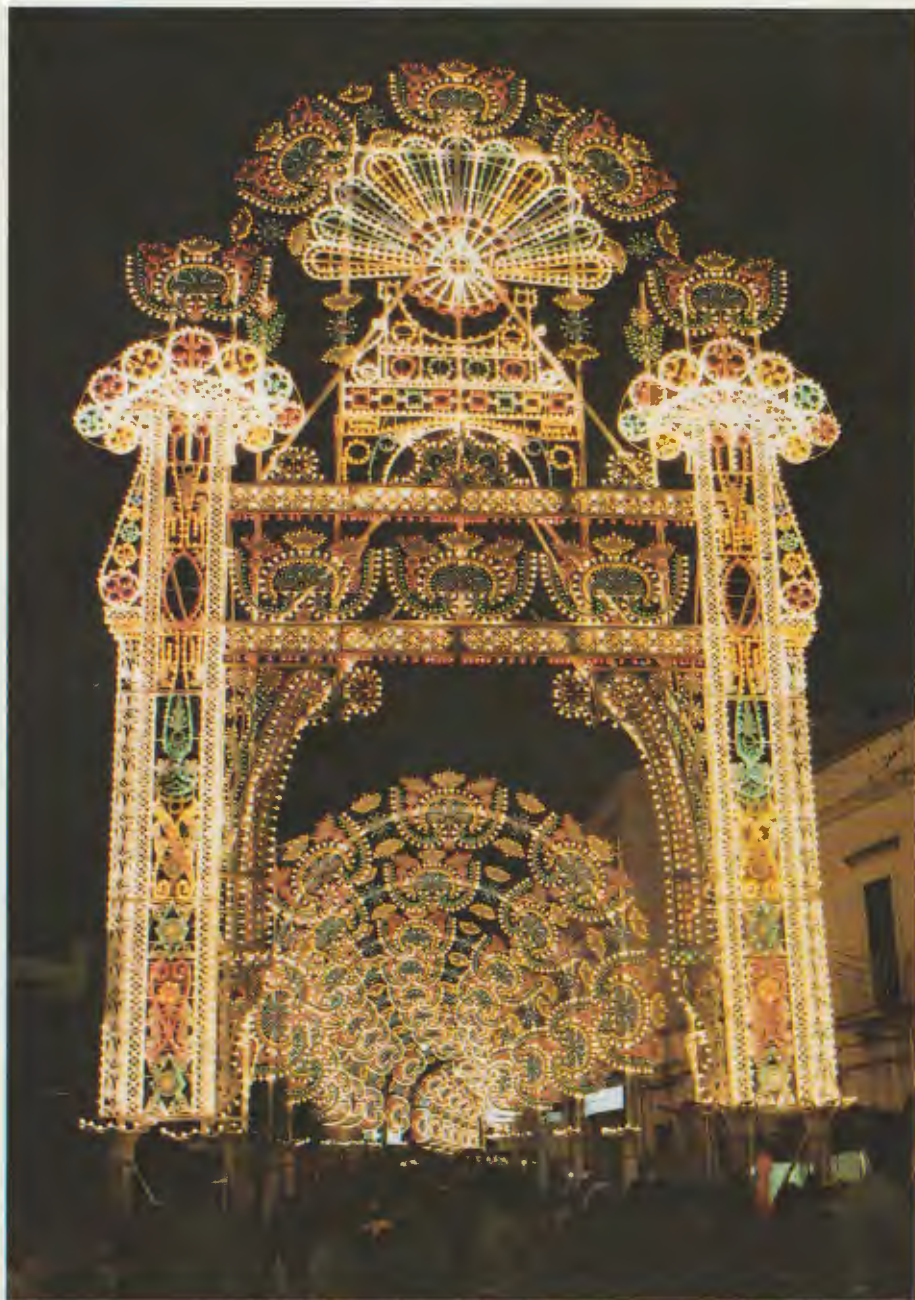
VEDUTA PARZIALE DELL'ALLESTIMENTO 1987