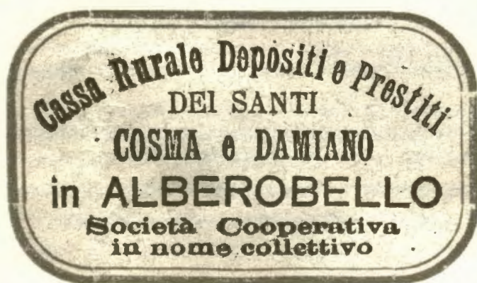
Riproduzione del timbro originale della Cassa Rurale Depositi e Prestiti dei Santi Cosma e Damiano. 1904

Come avviene in Europa e in Italia sin dalla fine dell'ottocento, queste casse rurali depositi e prestiti, mediante operazioni di credito promuovono il risparmio dei cittadini e facilitano il pagamento di opere utili nel proprio settore di lavoro.