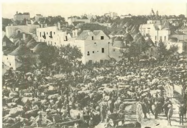
Mercato Fieristico in Largo Martellotta

Pensavamo che le feste di un certo rilievo e le fiere vicino alle stesse non sarebbero cambiate, o le strade di campagna sarebbero rimaste polverose, o gli angoli di paese sarebbero rimasti immutati e sempre poveri, tutti fenomeni, grandi e piccoli, della variegata ricchezza di un mondo minore. Abbiamo pensato che i grandi eventi non avrebbero scosso la quotidianità del centro agricolo, trasformatosi lentamente in uno a vocazione turistica. Non sono state registrate eccezionali cronache, ma mutamenti sociali a cui è seguito il benessere che, in una manciata di anni, ha frantumato le nostre migliori consuetudini, escludendole dalla storia.