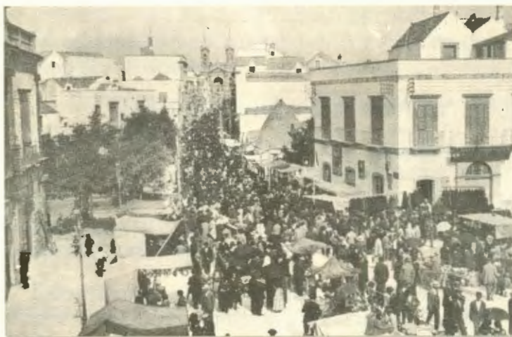
Festa dei Santi Medici. Mercato nel Corso. Settembre 1927

Divenne una scelta che non prevedeva ripensamenti ma fermezza. Di già si svolgeva in modo non legale «dalli 25 a 27 di sett. e» forse veniva accordato un permesso speciale come voleva una nota del Ministero dell'Interno di Napoli.