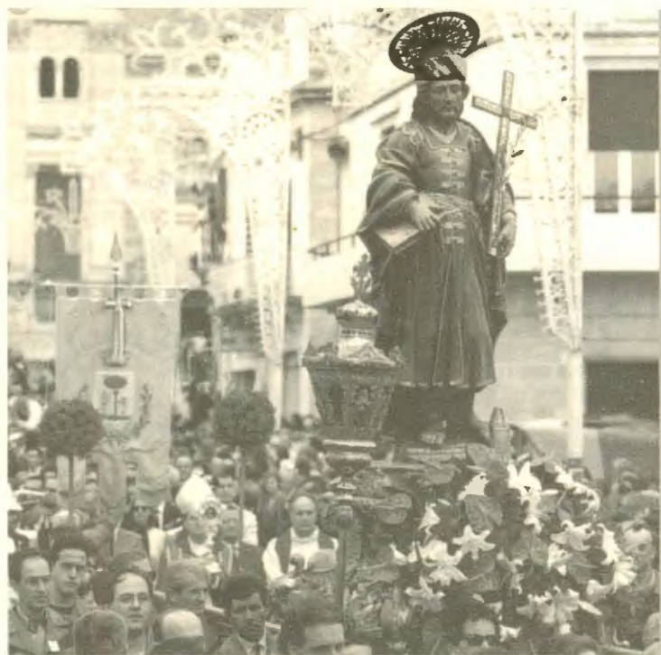
Immagine di San Cosma nella processione serale del 1998

Una certa logica e un certo buon senso hanno ridimensionato il comportamento della gente. Nessuno immaginava trenta o quarant'anni fa, che ci potessero essere Sante Messe all'aperto; che ci potesse essere un servizio d'ordine, una sala per le confessioni; che le immagini dei Santi potessero uscire dal baldacchino pieno di fronzoli; che le migliaia di candele confezionate con sego e stearina che affumicavano l'ambiente e lo impregnavano di... odore particolare, non potessero più consumarsi, fino a diventare moccoli, dinanzi alle statue; che alcuni devoti abbandonassero certe manifestazioni, talvolta esibizionistiche, più che espressione di vera fede e sincera pietà.