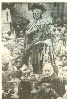
Una delle statue dei Santi, lungo St. Anthony Street, ad Est di Utica, in processione

Utica. Migliaia di persone dal New England, da New York, dal Canada e dalla Pennsylvania sono arrivati alla chiesa di sant'Antonio da Padova, il 27-29 settembre, per partecipare alla 79esima festa dei Santi Medici.