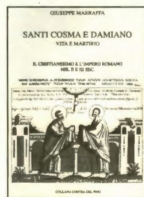
Copertina del libro dell'Autore

Inutile dire che fui entusiasta dell'opinione di Le Goff e la feci mia. Iniziai subito le opportune ricerche nelle più grandi biblioteche romane: La Calasanziana, l'Angelica e La Vaticana e comprai tutte le opere sull'argomento che potei trovare in commercio. Il lavoro di ricerca durò quasi quattro anni e il risultato, che considero incompleto e suscettibile di miglioramenti e di completamento, è sotto i vostri occhi e spero non deluda il lettore, almeno quello meno esigente.