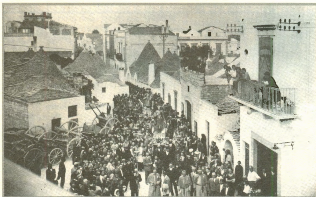
1927 La processione, proveniente dalla via Monte Grappa, sosta in via Piave

In quello stato d'animo, i rumori e l'invasione da parte dei forestieri del mio paese erano molto lontani. Faceva, però, capolino una certa malinconia al pensiero che al rientro, qualche giorno dopo, si doveva ritornare a scuola, perché allora le scuole riaprivano ai primi di ottobre.