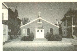
Cappella dedicata ai santi Cosma e Damiano

Alla festa ci sono molte specialità gastronomiche, dalla frutta candita alla pizza, dalla pizza fritta ai cannoli.