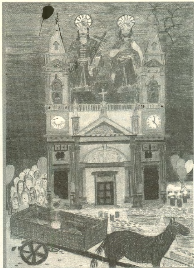
Licia Pastore - classe III D