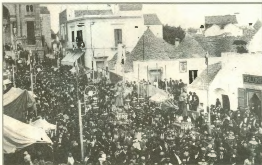
Processione 27 settembre 1927