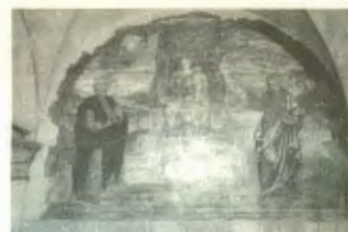
Fig. 1 Chiesa di san Rocco (Belluno)