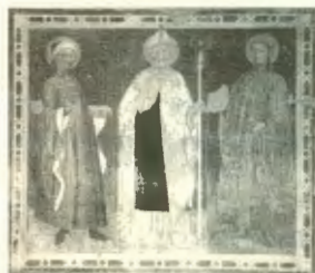
Fig. 2 Chiesa di san Zeno (Verona)

VERONA - I Santi Medici sono raffigurati in un affresco della chiesa di san Zeno sulla parete di sinistra sopra la scalinata (fig.2) che porta alla cosiddetta statua, detta dal popolo di san Zeno che ride, databile dal XIV secolo, e nella vicina chiesa romanica di san Prologo un sarcofago raccoglie le reliquie dei santi.