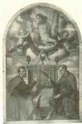
Fig. 3 Chiesa parrocchiale di Marmentino (Brescia). Altare maggiore, splendida tela del Moretto da Brescia (1498 - 1554) con i due Santi in adorazione dell'Eucarestia

Concludendo, numerose sono le testimonianze di quanto il culto dei due santi fratelli medici si sia mantenuto vivo per secoli nelle terre della Serenissima Repubblica di San Marco. Molto ancora c'è da fare e, spero, se la Provvidenza Divina e l'intercessione dei Santi Medici lo vorranno, di poter scoprire altre chiese, oratori, quadri, luoghi che aiutino ancor più a capire la devozione della gente veneta verso i due martiri medici che hanno speso tutta la loro breve vita a divulgare la parola di Cristo e a risanare, senza farsi pagare mai, i corpi degli uomini e degli animali.