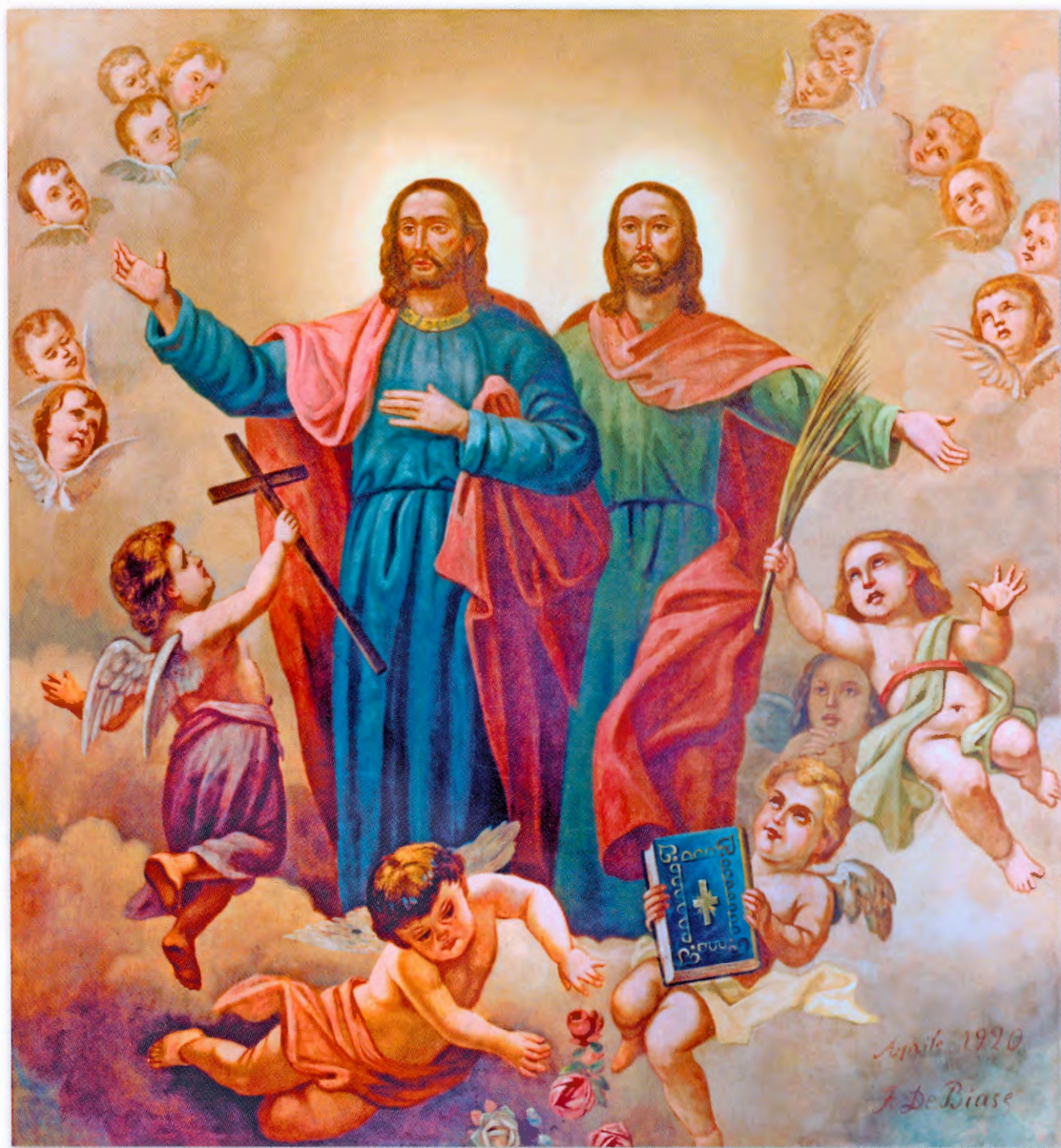
La gloria dei santi Cosma e Damiano

Affresco di Francesco De Biase, 1920, basilica dei santi medici Cosma e Damiano - Alberobello