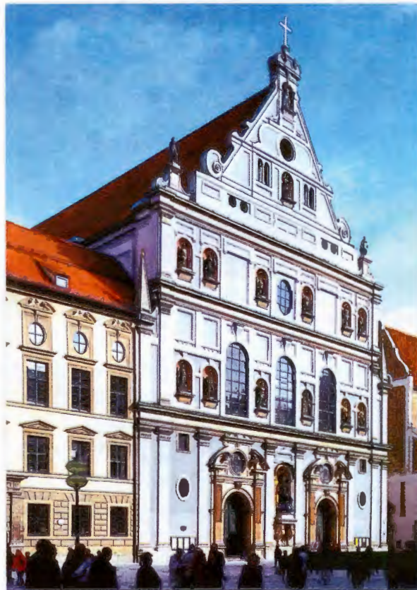
Monaco di Baviera, chiesa di S. Michele

Le due porte dello scrigno mostrano all'interno immagini con scene di guarigioni tratte dalla vita di Cosma e Damiano.