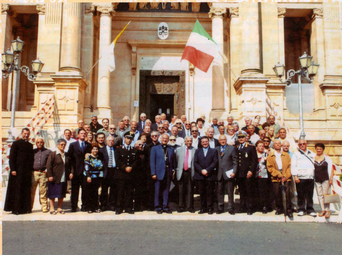
Basilica dei santi Cosma e Damiano, 28 settembre 2009 Autorità Civili, Militari e Religiose con cittadini residenti in Italia e all'estero.