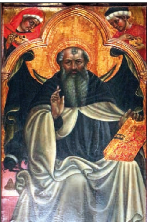
Fig. 2 - Volterra (PI) - oratorio Sant'Antonio abate - Priamo della Quercia, Trittico di sant'Antonio e Cosma e Damiano (1442)