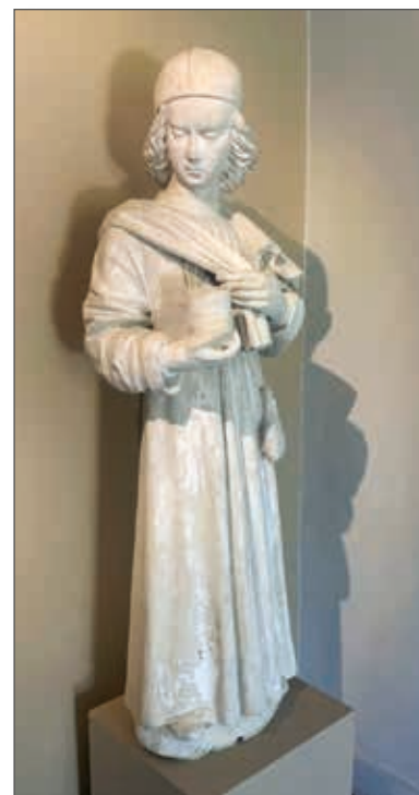
San Cosimo, statua originale

I recenti scavi archeologici confermano la vocazione del priorato San Cosimo: l'accoglienza medica e l'assistenza a chi ne aveva più