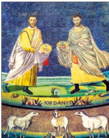
Ritratto dei Santi Cosma e Damiano nel mosaico