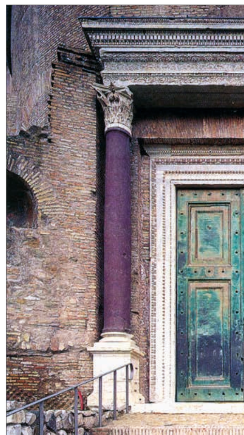
Antica porta di bronzo della Basilica sulla Via Sacra