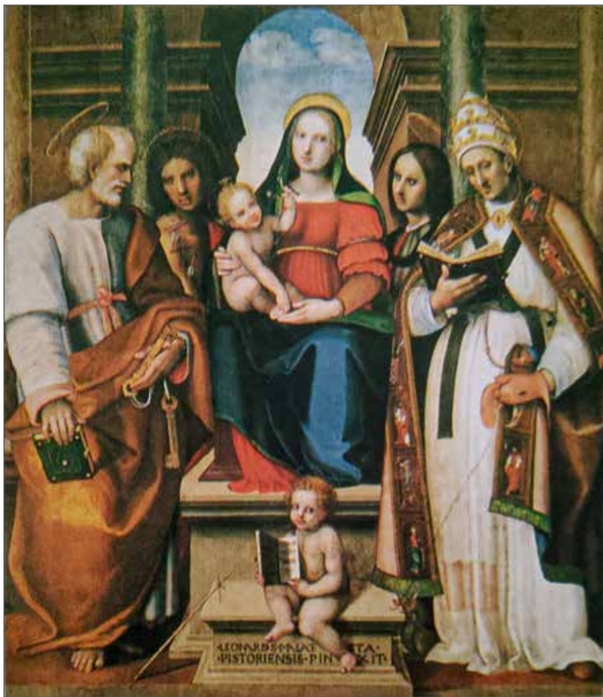
Fig. 4 - Casalguidi (PT), chiesa di San Pietro - Leonardo Malatesti, Madonna col Bambino fra santi (1518)

Bussi (2002) nel libro curato dalla E. Giannarelli sui santi Medici, che a sua volta menziona l'opera dello studioso P. D'Ancona (1914).