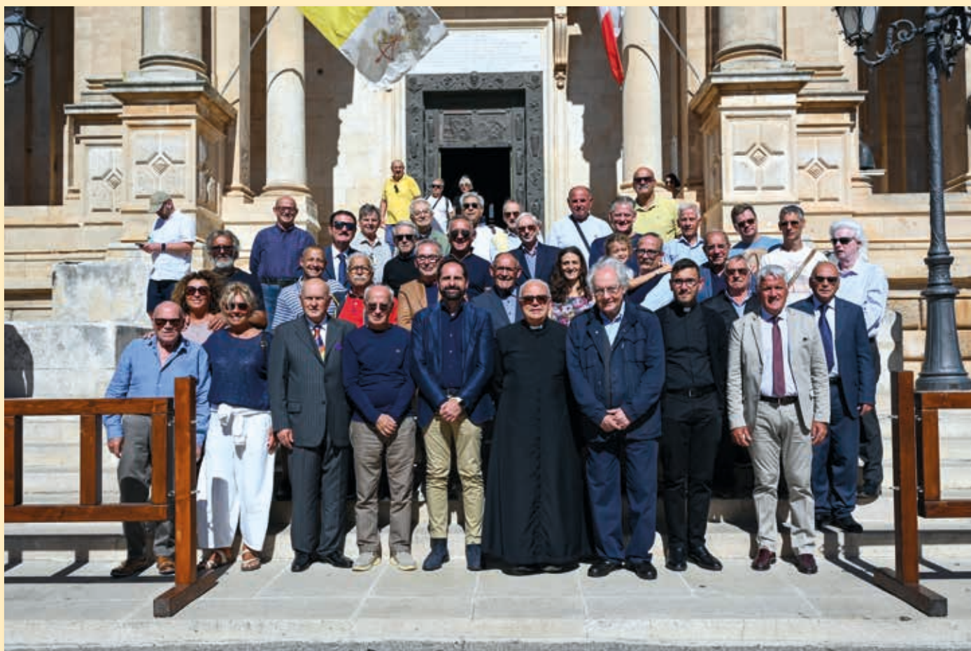
Basilica dei santi Cosma e Damiano, 28 settembre 2024 Autorità Civili e Religiose davanti al Santuario-Basilica