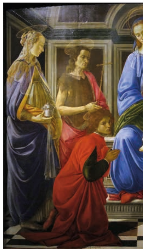
Fig. 1 - Firenze, Galleria degli Uffizi - S. Botticelli, Santi Medici nella pala di Sant' Ambrogio (1470)

A Sant' Ambrogio in Firenze vi è l'opera pittorica (1475-1500 circa) Gesù crocifisso tra quattro santi tra i quali Cosma e Damiano , attribuita inizialmente a Cosimo Rosselli, mentre il vero autore è Antonio di Benedetto di Giovanni. Lo stesso Antonio, figlio dell'orafo Benedetto fiorentino, è l'autore di un'altra opera negli stessi anni, raffigura la Circoncisione del Bambino con i santi Cosma e Damiano del 1511, proveniente dalla chiesa di Sant' Angelo in Legnaia,