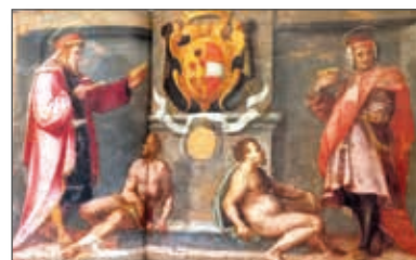
Fig. 5 - Bologna, Collezione Cassa di Risparmio - Maso da San Friano - santi Cosimo e Damiano su tavola (1570)