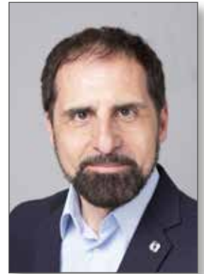
Francesco De Carlo SINDACO DI ALBEROBELLO

Ringrazio il Comitato feste patronali che con grande impegno e tenacia ridesta e rafforza la religiosità dei fedeli organizzando una festa solenne all'insegna della preghiera e devozione, non facendo mancare le molteplici attività religiose e culturali che fanno da corollario alla festa arricchendola – edizione dopo edizione - di nuovi contenuti.