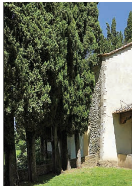
Fig. 5 - San Piero a Sieve (FI), Villa medicea del Trebbio - Santi Medici titolari della cappellina

È evidente che a Firenze e in Toscana il culto dei Santi Medici ebbe un incremento rilevante, nell'ottobre del 1434, dopo il ritorno dall'esilio politico di Cosimo il Vecchio. Sono dovuti a iniziativa di alcuni alti prelati la fondazione di due luoghi di culto: dal 1554 a Nugola, frazione di Collesalveti (LI), di cui si conserva ben poco; mentre in quella di Vivaio di Incisa, oggi parte del comune di Figline Valdarno , vi sono il convento e la chiesa intitolata ai due Santi dal