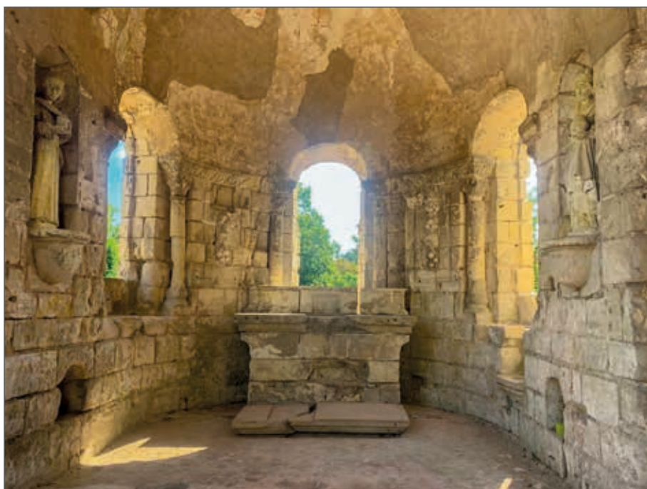
Priorato dedicato a St. Cosmas Abside - Simulacri in copia

L'esposizione archeologica « Soigner Corps et Âmes » (“Curare Corpi e Anime”), proposta al pubblico dal 14 giugno al 12 ottobre 2025, permetterà di imparare di più sui saperi, sui metodi e sugli strumenti di cura dal XII secolo fino alla Rivoluzione francese.