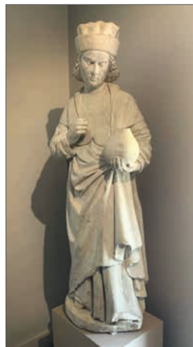
San Damiano, originale