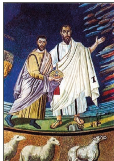
San Paolo presenta san Damiano

Sotto la composizione musiva corre un'iscrizione poetica in lettere auree su fondo azzurro intenso.