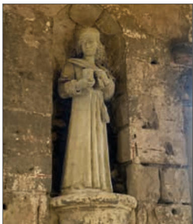
San Cosimo, copia