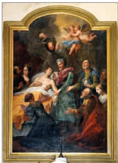
Fig. 7 - Pescia (PT), cappella dell'ospedale - G. Santarelli, San Cosma e san Damiano (1700)

Una menzione lodevole per la sua atmosfera mistica, che aiuta la contemplazione del 'più povero di fede' e che consiglierebbe, è il Santuario mariano di Bibbiena (AR), a due passi da quello della Verna e dalla casa originaria di Camaldoli, dove all'interno fino a pochi anni fa, veniva segnalato un quadro di fine Quattrocento che raffigura anche i santi Cosimo e Damiano, attribuito a Matteo da Lappoli o a Gherardino del Fora. L'ambientazione particolare del santuario rimane suggestiva anche qualora si trovasse il portone non aperto.