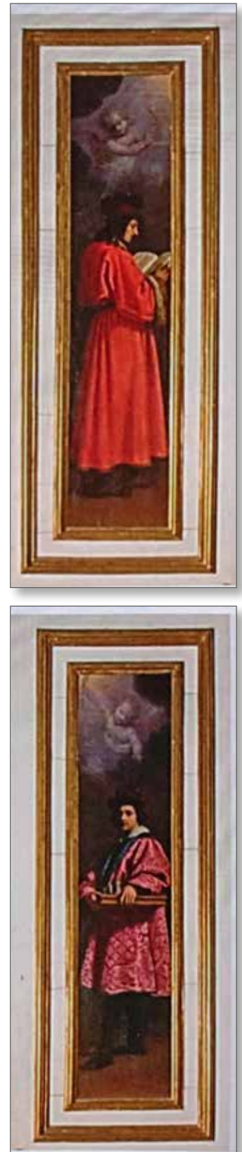
Fig. 7 - Firenze, Palazzo Pitti - G. Bilivert, ante di armadio di reliquie (1618)