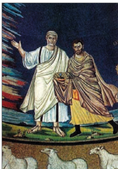
San Pietro presenta san Cosma

Sono tre coppie di versi disposti secondo lo schema classico del distico elegiaco, che implica un esametro seguito da un pentametro.