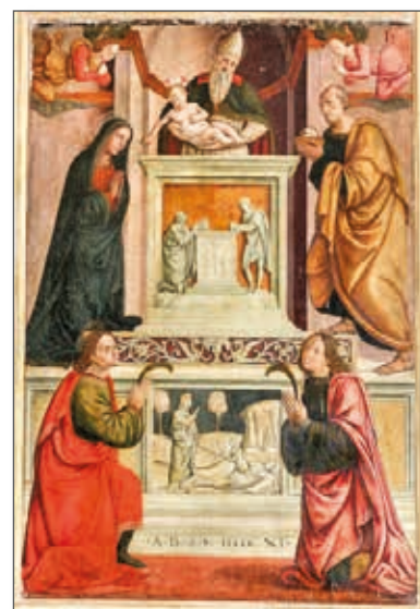
Fig. 2 - Legnaia (FI), chiesa sant' Angelo. Maestro del Tondo Borghese, i Santi Medici in una tela della Circoncisione del Bambino (1511)