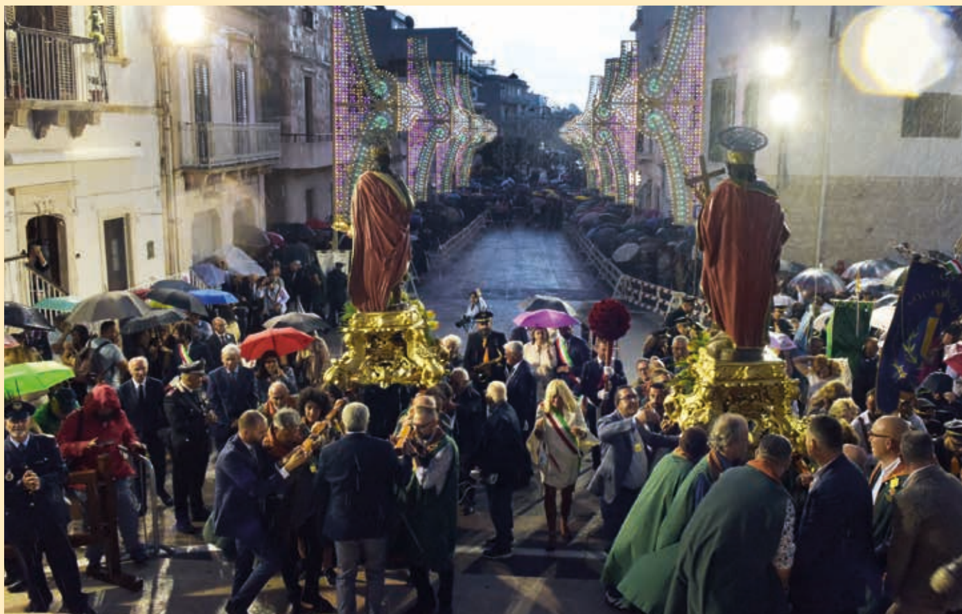
28 settembre 2024 - La processione serale indugia per la pioggia