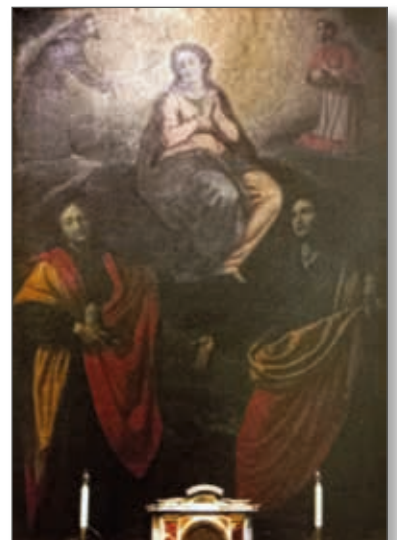
Fig. 6 - Figline Valdarno (FI), Vivaio di Incisa - Santi Medici (1730 ca.), chiesa omonima