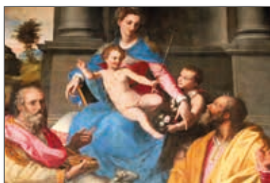
Fig. 6 - Val d'Ema, c/o Impruneta (FI) - Alessandro Allori, Madonna col Bambino e Santi Medici (1582)