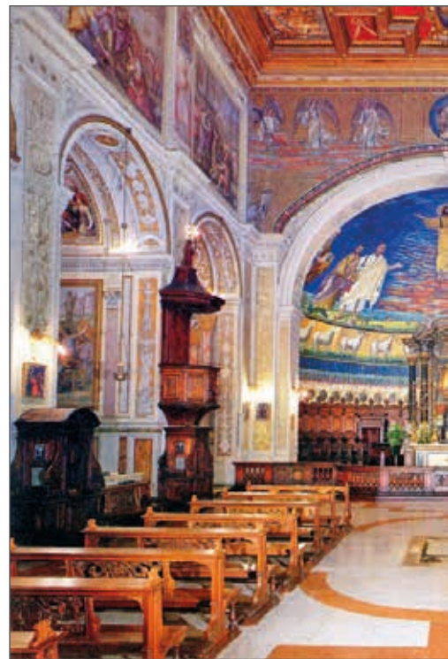
Roma, Basilica dei Santi Cosma e Damiano con lo splendido mosaico del 526-530

Mentre curavano i mali fisici, erano anche premurosi di porgere il messaggio cristiano: indirizzavano i malati verso Cristo salvatore, medico supremo e speranza certa nelle sofferenze.