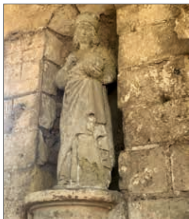
San Damiano, copia

bisogno. Sebbene la cura ai monaci malati e ai pellegrini fosse missione di ogni monastero, l'analisi dello stato sanitario delle persone sepolte rivela una specialità chirurgicale particolare. Infatti, gli scavi hanno permesso di identificare sei uomini trapanati (monaci e laici), quantità eccezionale a livello europeo. Si sa che solo un uomo non è sopravvissuto, ciò conferma la qualità dei chirurghi presenti nel priorato San Cosimo. Lo studio comparativo dello stato sanitario degli individui inumati nel monastero e di sei altre popolazioni medievali della zona di Tours ha sottolineato la caratteristica e il ruolo specifico del priorato San Cosimo nelle infrastrutture mediche della regione. Tours è, quindi, stata terra di accoglienza per pellegrini venuti da tutti gli orizzonti e anche per benefattori al livello più alto della società.