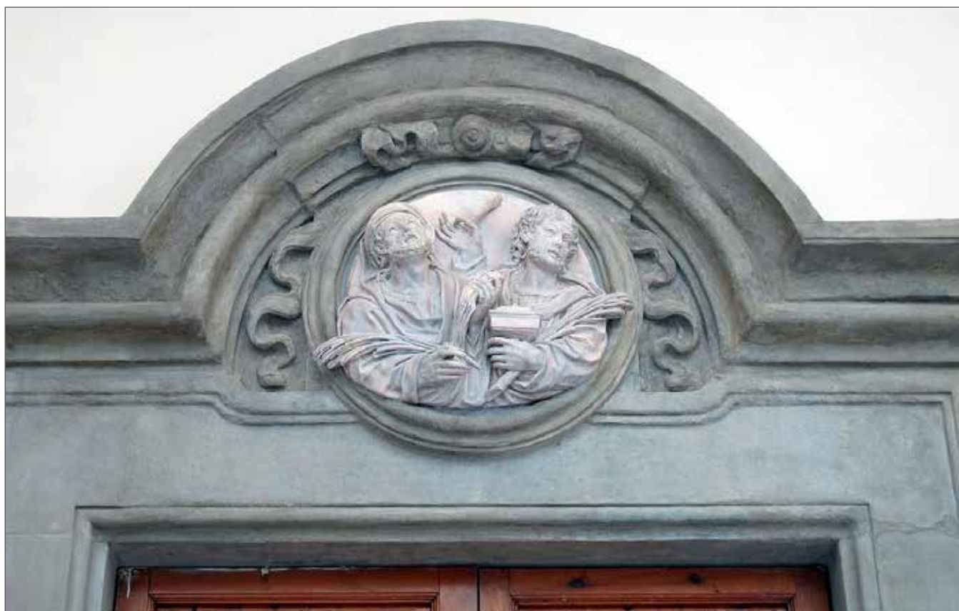
Fig. 9 - Firenze, Spedale Santa Maria Nuova (1718), lunetta di portale

dei Divettini aveva avuto il patronato su una cappellina intitolata ai santi Cosma e Damiano nel transetto sinistro di questa chiesa, tra gli anni 1590 e 1620 circa. I suoi Capitoli sono messi per iscritto nel 1635. La Cappellina era intitolata ad altri santi: sant'Orsola e san Sebastiano e fatta reggere in ius patronato da altre famiglie come i Giamboni, i Coletti. Ora è stata inglobata, come altre due, nella stessa sezione, dal 1771 nell'attuale grande Cappella del Crocifisso della Provvidenza nel transetto-parte nord, subito a sinistra della Cappella Maggiore, la simil-abside principale dell'intera chiesa carmelitana. I "divettini" erano coloro che 'divettavano' la lana, battitori dei prodotti fatti o imbottiti di lana. I divettini battevano materassi, cuscini e anche abiti con lo scamato, una speciale bacchetta di legno duro, per togliere le impurità e le polveri residuali. È insolito vedere i Divettini affezionati ai Santi Medici perché a Firenze, nel Medioevo, le corporazioni di mestiere con cui loro avevano più a che fare: l'Arte della Lana, quella dei Mercanti di Lana, della Calimala e la effimera Arte dell'Agnolo, avevano altri santi patroni: san Michele Arcangelo, santo Stefano, il Battista. La chiesa fiorentina del Carmine è la stessa che contiene la famosa Cappella Brancacci affrescata dal Masaccio e musealizzata; nei pressi della stessa, in locali dati in affitto dai frati, nacque l'artista Filippo Lippi.