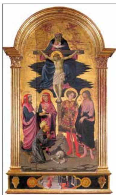
Fig. 3 - Firenze, Galleria dell'Accademia - Apollonio di Giovanni, Santi Medici in una Santissima Trinità tra santi (1460)

Un altro artista è il fiorentino Tommaso Manzuoli, detto Maso da San Friano, nato nel rione san Frediano, a noi noto negli anni 1532-1571. Intorno al 1570, mentre stava intervenendo nella decorazione dello studiolo del granduca Francesco I Medici in Palazzo Vecchio a Firenze, compie l'opera pittorica (olio su tavola cm 28 x 46) I Santi Cosma e Damiano, in piedi, che supervisionano due