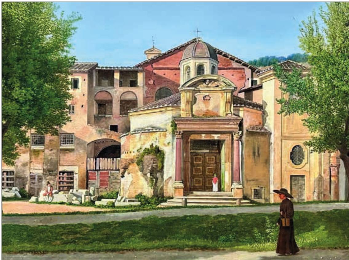
Metropolitan Museum of Art - New York - Chiesa dei santi Cosma e Damiano (1814-1815 ca.) di Christoffer Wilhelm Eckersberg. Facciata antica lungo la Via Sacra, Roma

5 «Martyribus medicis» = ablativo causale: a motivo del loro martirio; oppure: poiché essi sono stati martiri coraggiosi, al popolo cristiano è garantita la speranza della salvezza.