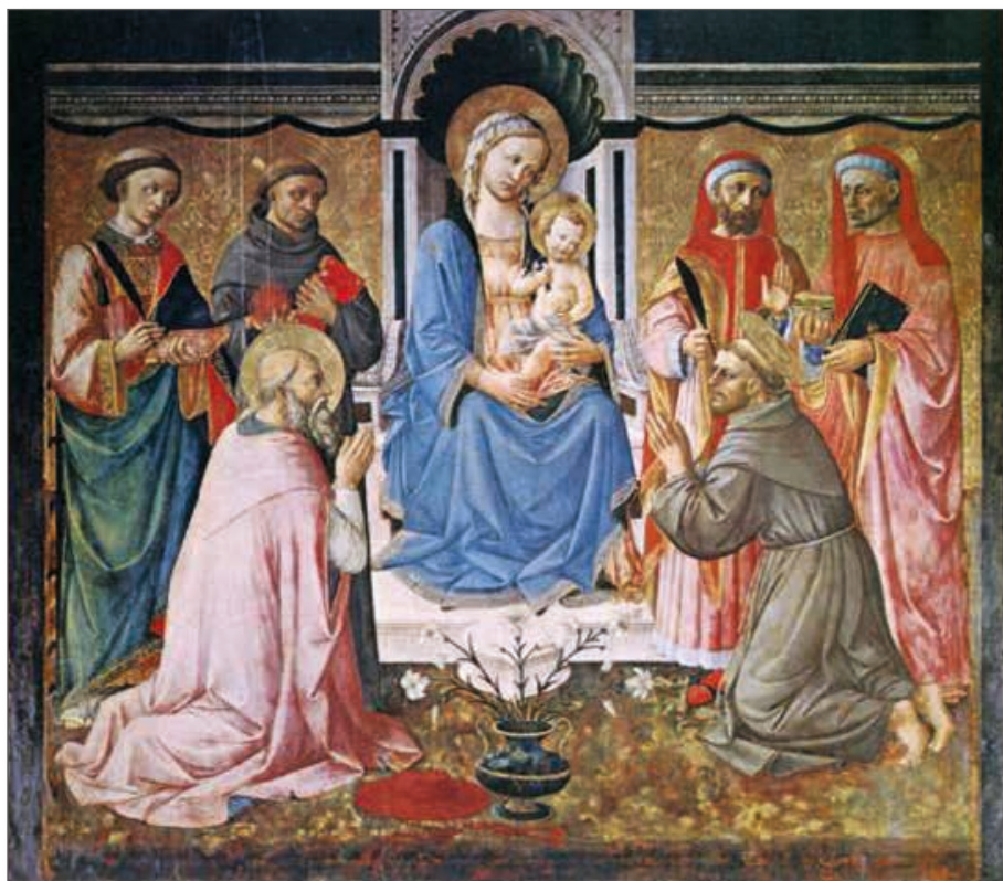
Fig. 1 - Volterra (PI), chiesa San Girolamo - Museo diocesano - Domenico di Michelino, Madonna con Bambino tra i santi (1465)

Sempre in Volterra, sede di diocesi, vi è l' oratorio di sant'Antonio abate , detto in antico 'alla Ripa', dal 1470 nella forma attuale, ma già fondato tra il XII e il XIII secolo. In esso vi è dal 1442 di Priamo della Quercia un Trittichetto richiudibile raffigurante sant'An-