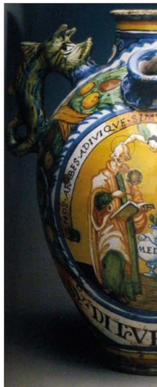
Fig. 4 - Albarello di ceramica del 1500 - Manifattura di Montelupo (FI), collezione privata

Nel fondo di deposito del Museo Cenacolo di san Salvi di Andrea del Sarto, a Firenze, poco accessibili, si trovano due opere provenienti da edifici religiosi situati in pieno centro: un dipinto ligneo di ambito fiorentino, che raffigura i santi Cosimo e Damiano al chiuso è degli anni 1540/1565 circa con un paesaggio esterno in prospettiva, racchiuso tra colonne, già custodito nei magazzini agli Uffizi nell'Ottocento, proveniente dal convento di Suore Agostiniane di san Clemente - ex san Gherardo dei Tavolaccini , situato quest'ultimo in via San Gallo, ormai in disuso, attribuibile a un seguace della 'scuola sartesca', identificabile con Pier Francesco Foschi collabo-