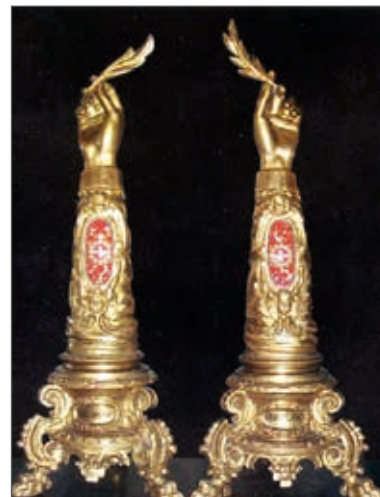
Reliquiari dei Santi Medici martiri