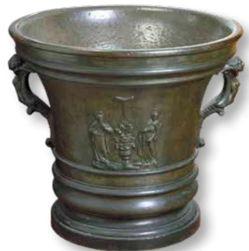
Fig. 10 - Firenze, Museo della Scienza - Santi Medici in rilievo su mortaio in bronzo da farmacista (1764)