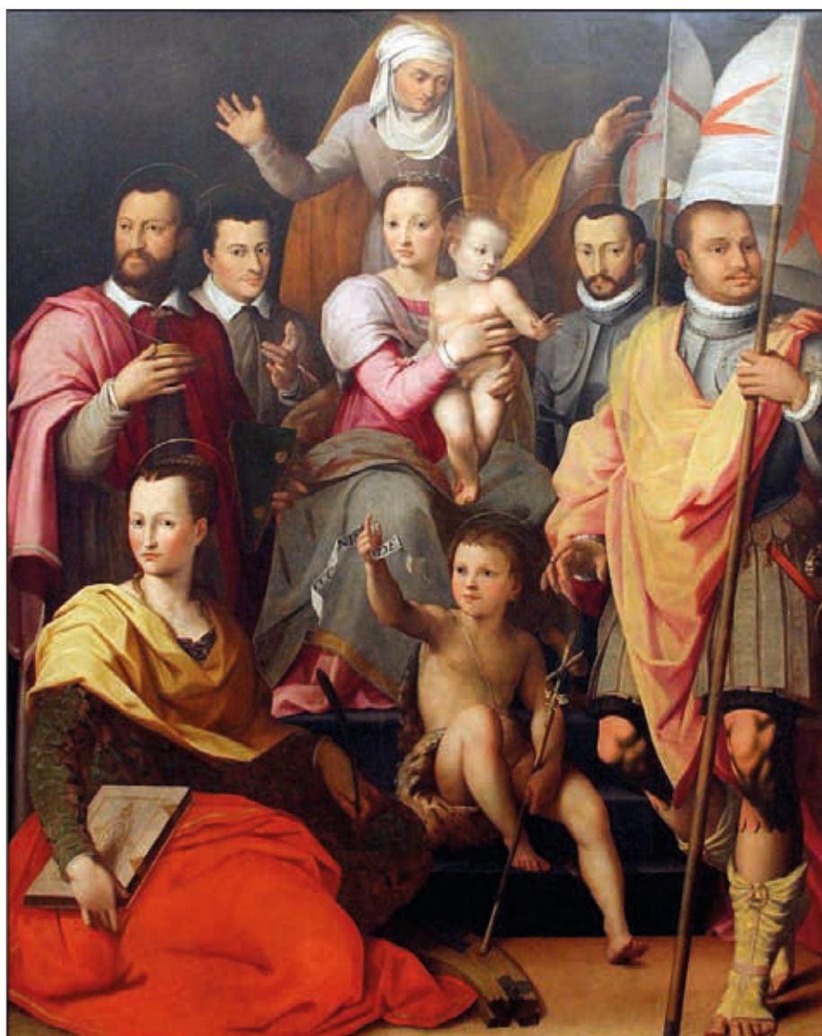
Fig. 12 - Firenze, Villa di Cerreto Guidi - Conversazione tra santi (sono personalità della Famiglia Medici), 1575

Il pittore fiorentino G. Maria Butteri, allievo del più illustre Alessandro Allori, realizza la Vergine con Bimbo e sant'Anna con membri della famiglia Medici in veste di santi tra cui due di loro come Cosma e Damiano (1575). Ora il grande quadro è negli ambienti della villa medicea di Cerreto Guidi; in precedenza era nei depositi del Museo Cenacolo di Andrea del Sarto, a San Salvi, appena fuori dal centro di Firenze (Fig. 12).